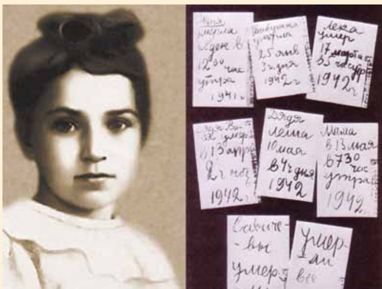
Таня Савичева. Страницы из ее дневника

Зимой 1941 — 1942 года город сковала лютая стужа. Замерзли водопровод и канализация. Прекратилась подача электричества, остановились трамваи, троллейбусы, автобусы. Но истощенные, голодные, обессиленные и измученные люди продолжали оказывать сопротивление врагу, несмотря на то, что смерть входила в каждый дом, в каждую семью.