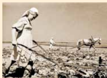
За плугом и за штурвалом трактора

К штурвалам комбайнов и тракторов, к упряжкам лошадей вместо отцов, мужей и братьев, ушедших на фронт, встали женщины и дети.