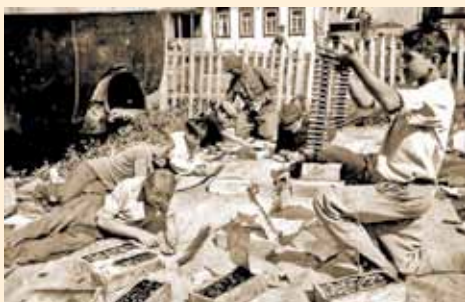
Набивка пулеметных лент