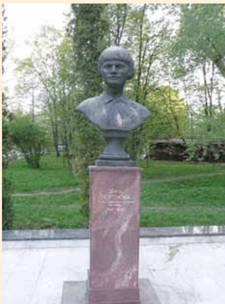
Бюст Зины Портновой. Москва. ВДНХ