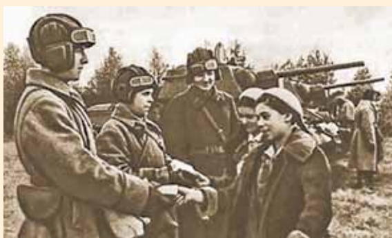
Передача танка «Ташкентский пионер»

С 1942 года на фронтах громили фашистов танки «Горьковский пионер», «Московский пионер», «Пионер Башкирии», «Ташкентский пионер», «Школьник Свердловска» и др. Пионеры собирали, шили и вязали теплые вещи для фронтовиков, отправляли на фронт подарки.