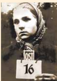
Узница с востока