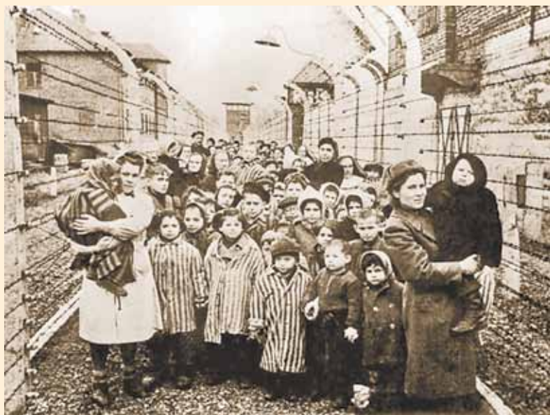
Освобожденные дети из концлагеря

Дети, которые вынесли на своих хрупких плечах все ужасы оккупации фашистских концлагерей, рабство у немецких бюргеров, тяжелейший труд на заводах и фабриках фашистской Германии, они тоже совершили подвиг — подвиг на выживание!