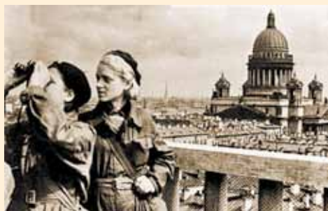
Противовоздушная охрана своего дома

При бомбежке города подростки, юноши и девушки дежурили и тушили зажигательные бомбы на чердаках своих домов, ухаживали за ранеными, снаряжали патронами пулеметные ленты.