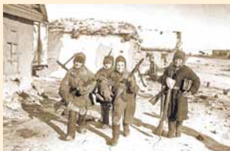
Для них война продолжалась

Там, где шли бои, война оставила много оружия и боеприпасов. Дети, особенно подростки, не могли пройти мимо. Они стреляли из винтовок, пистолетов, автоматов. Пытались бросать гранаты, разряжать снаряды. И гибли. Большим бедствием для вездесущих подростков были мины, которые отступая оставили оккупанты.