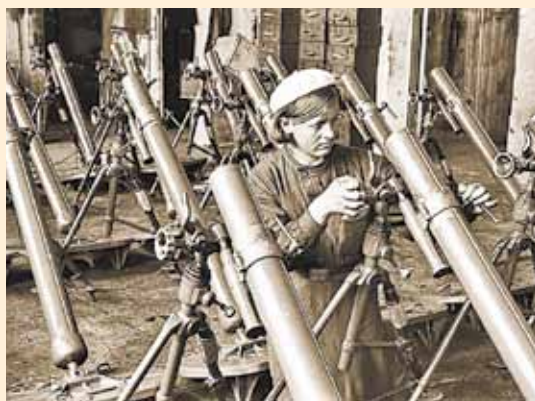
Они заменили своих отцов

27 июня 1941 года «Правда» сообщала, что около 2 тысяч московских школьников пришли на промышленные предприятия, чтобы заменить ушедших на фронт.