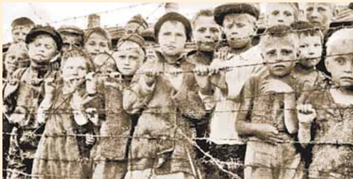
Дети в концлагере Майданек. Польша

что Родина о них помнит, что Красная Армия непременно разгромит оккупантов, освободит их из неволи.