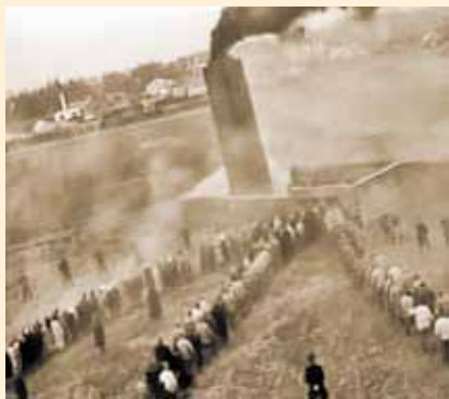
Фашисты сгоняют людей в крематорий

Лишенные всякого общения с внешним миром, маленькие дети не имели представления о самых простых вещах. Они не видели и не знали животных. Птиц, пролетавших над лагерем, они видели только из окна. Никогда не видели и не пробовали фрукты и овощи. Не знали, что это такое.