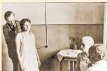
Медицинский осмотр на границе с Германией

В пути следования их кормили один раз в сутки. Давали 150 граммов хлеба, в котором муки не было, готовили его из отрубей, костной муки и опилок, наливали кружку эрзац-кофе. Иногда кормили баландой из брюквы и картофельных очисток. Если эшелон с узниками попадал под бомбежку или артобстрел, то убитых и раненых из вагона не выносили до границы с Германией.