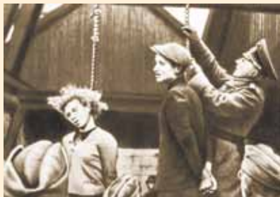
Казнь советских патриотов в Минске