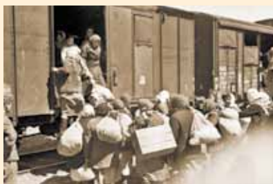
Погрузка юных узников