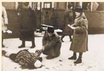
Еще одна жертва

Этот документ обличает войну, связанную фашистами и принесшую человечеству огромные потери и неисчислимые страдания. От голода и холода люди умирали прямо на улицах.