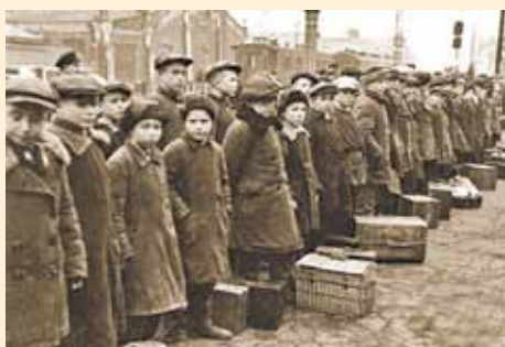
Прибыли работать на завод

Значительный вклад в производство продукции для фронта внесли выпускники ремесленных училищ и школ ФЗО, в которых с июля 1942 по 1945 год различные производственные специальности получили более 2 миллионов юношей и девушек. На один из заводов Свердловска в начале 1942 года пришло более 100 выпускников ремесленных