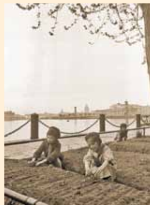
Грядки на набережной Невы

Первые листочки крапивы, березы, лебеды шли в пищу. Взяв лопаты, дети вскопали все скверы, парки, клумбы. Каждый свободный клочок земли засеяли семенами капусты, редиса, щавеля, лука, чеснока. Ухаживая за своими участками, поливая, пропалывая, дети получили хороший урожай овощей к своему скудному пайку.