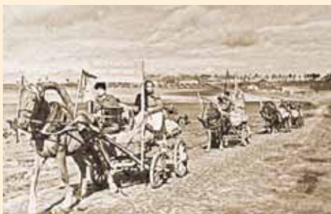
Хлеб Красной Армии

Большую помощь оказали школьники в сборе дикорастущих плодов и лекарственных растений. Только в 1941 — 1944 годах они собрали 240 784 тонны.