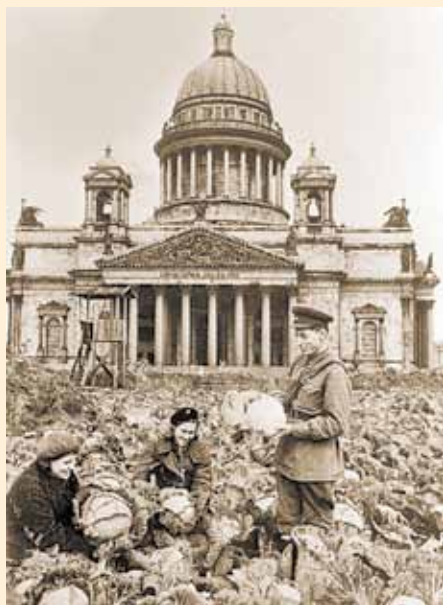
Богатый урожай у Исаакиевского собора

Весной у школьников началась «огородная жизнь».