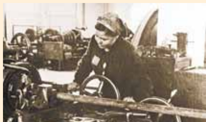
Работница-остарбайтер, работающая на заводе «Опель-Руссельхайм». 1942 год

Юноши, девушки и подростки, которые трудились на немецких заводах и фабриках, старались под любым предлогом не выполнять свою норму, делали брак. Если они работали там, где бомбы и снаряды наполняли взрывчатым веществом, то вместо него в них засыпали песок или землю и помещали записку