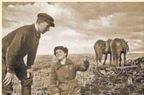
Земля хранила в себе не только мины... но и железные кресты