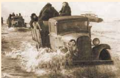
«Дорога жизни» работала днем и ночью