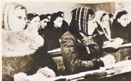
Несмотря на холод, занятия в школе продолжались

Недостаток питания сказывался на всех. В декабре-январе умерло одиннадцать мальчиков. Остальные мальчики лежали и не могли дойти до школы. Остались только девочки, но и те еле-еле ходили. Но учеба шла. Шла и пионерская работа. В том числе сбор подарков — папирос, мыла, карандашей, блокнотов для бойцов Ленинградского фронта.