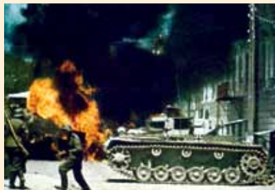
В нашу страну пришли оккупанты

Чтобы сломить моральный дух советских людей, гитлеровцы установили на оккупированных территориях режим кровавого террора.