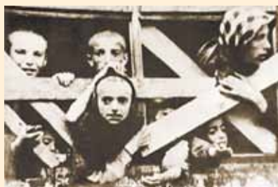
Вагон с детьми готов к отправке

В Германию отправляли не только молодежь. Туда эшелонами гнали семьи партизан и подпольщиков, в основном это были женщины с маленькими детьми, жители деревень и сел, сочувствующие партизанам. Их загоняли в товарные вагоны, как скот. В невероятной тесноте потерявшему силы человеку не было возможности даже вытянуть ноги. В вагонах с маленькими окошками, обитыми металлическими решетками, с парашей в углу, в жаркую погоду нечем было дышать. Обреченные на смерть и страдания люди теряя сознание, умирали. Зимой они гибли от холода и голода.