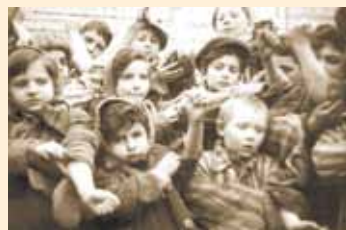
Дети показывают свое клеймо с номером на руке

На границе все узники проходили медицинскую комиссию, их стригли, ставили клеймо с номером на руку. Теперь это были их имена и фамилии.