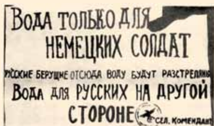
Объявление новой немецкой власти