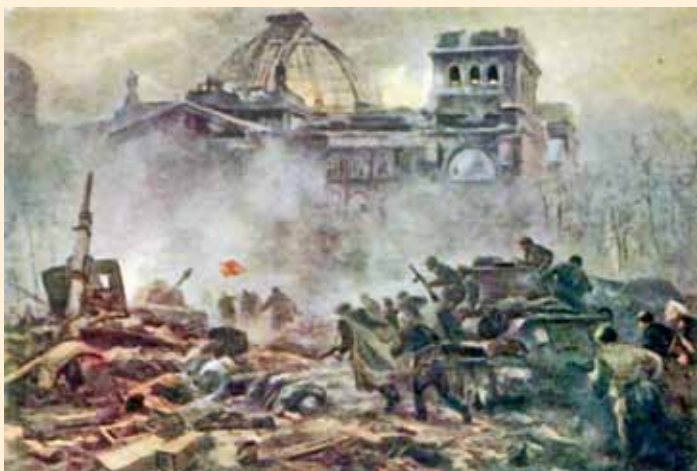
Штурм Рейхстага. Худ. В.В. Богаткин