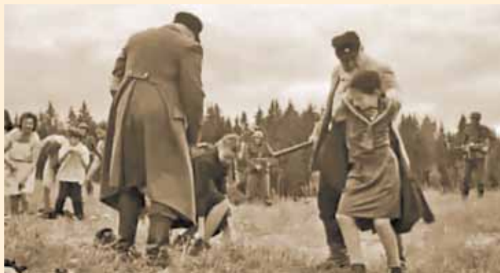
Палачи ведут детей на расстрел