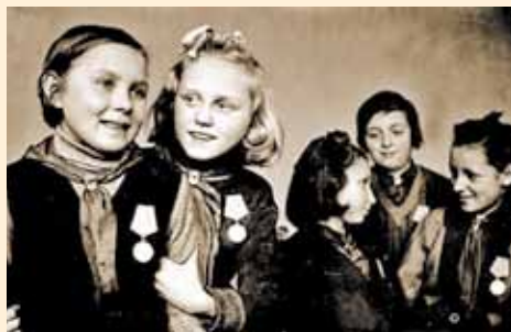
Отличницы 4-го класса 47-й школы г. Ленинграда, награжденные медалями «За оборону Ленинграда». Ноябрь 1943 г.

За самоотверженный труд в тылу тысячи подростков были награждены орденами СССР, медалями «За трудовую доблесть», «За трудовое отличие», «За доблестный труд в Великой Отечественной войне 1941 – 1945 гг.».