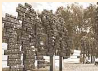
«Стена памяти» в Хатыни